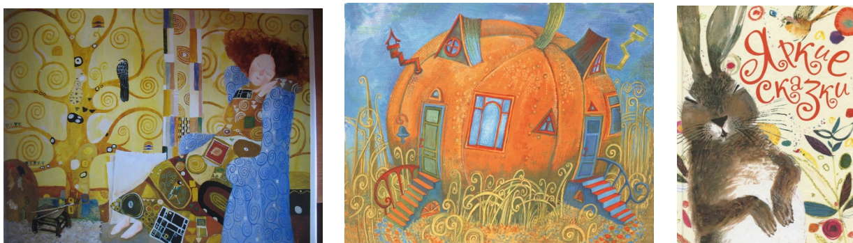
Варианты оформления издания для детей

Выполнение иллюстраций и художественного оформления книжного издания для детей.