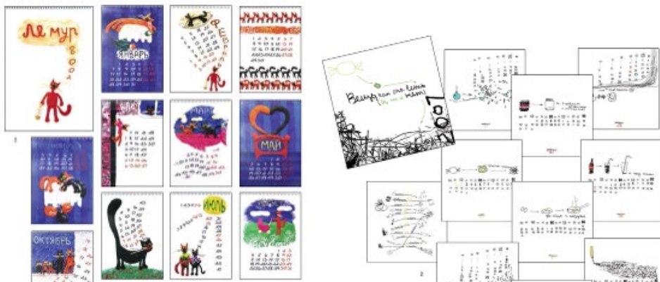
Варианты оформления календаря

Выполнение технического и художественного оформления настенного календаря.