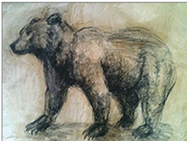
Примеры выполненных работ: