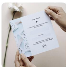
Подарочный серти... 500 Р