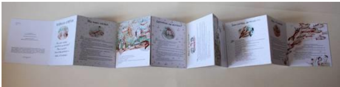
Варианты оформления книжки-раскладушки