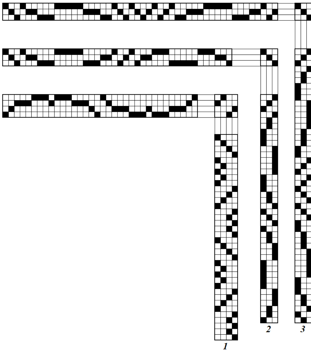
Рис. 1. Элементы мотивного патрона (варианты 1 – 3)