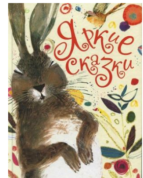
Варианты оформления издания для детей