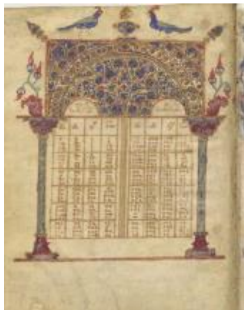
Таблица канонов; Византия; XI в.; памятник: Evangelia quatuor. (Grec 8409 BNF); 16 x 21 см.; местонахождение: Франция. Париж. Национальная Библиотека Франции

5. Определить произведение искусства и время создания