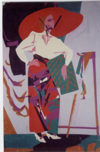
Пример выполнения задания

4 Выполните в декоративной манере этюд постановки с фигурой с включением текстильных рисунков