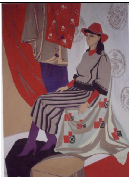
Пример выполнения задания

4 Выполните в декоративной манере этюд постановки с фигурой с включением текстильных рисунков