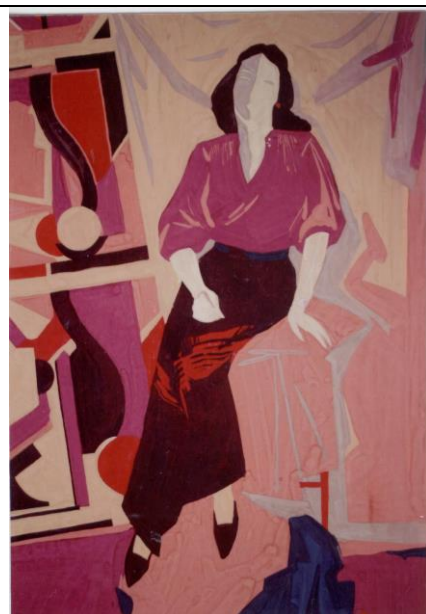
Пример выполнения задания

5 Выполните в декоративной манере этюд фигуры в теплых тонах