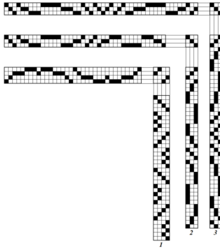
Рис. 1. Элементы мотивного патрона (варианты 1 – 3)