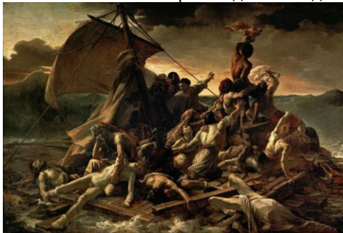
Жерико. Плот Медузы

Указать живописное произведение академического направления