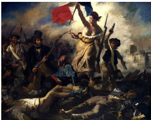
Делакруа. Свобода, ведущая народ на баррикады