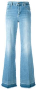
Джинсы с клёшем от колена

7. Какой элемент гардероба противопоказан девушкам с типом фигуры «груша»?