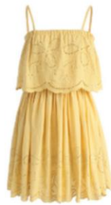
Платье с драпировками