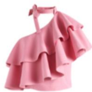
Топ с рюшами