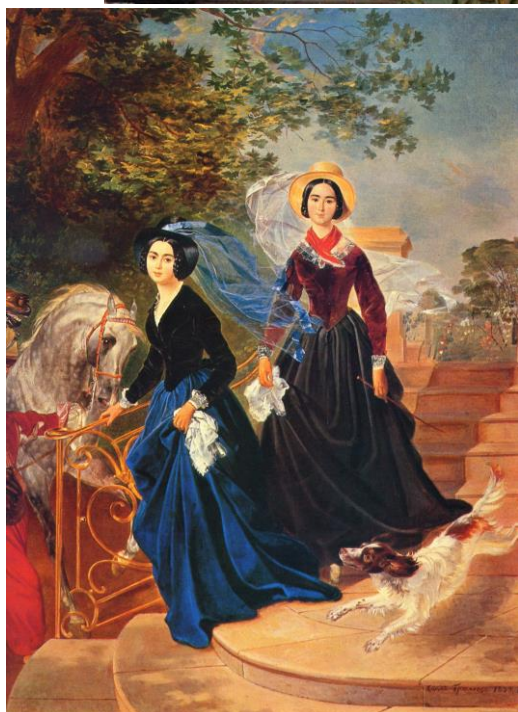
Портрет княгини Е. В. Салтыковой. Брюллов. 1839 г. Специальные термины: Костюм «амазонка»,