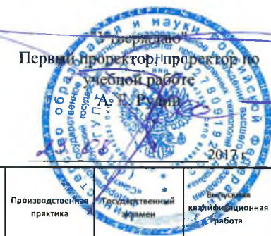
График учебного процесса СПбГУПТД на 2017/2018 учебный год