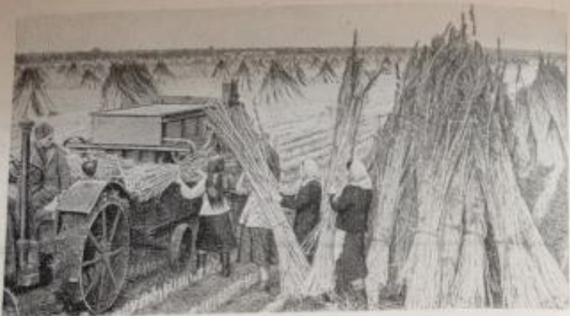
Обмолот конопли в колхозе имени Крупской, Брюховецкого района, Краснодарского края.

ционную молотилку. При этом освобождается транспорт, необходимый для подвоза снопов, и значительно сокращаются потери семян. По подсчетам Михайловской МТС, затраты на одну тонну семян конопли, намолоченную самоходным комбайном, составляют 61 рубль и 6,3 человеко-дня, а при обмолоте коноплекомолотилкой МКС-1,5 — 108 рублей и 11,5 человеко-дня.