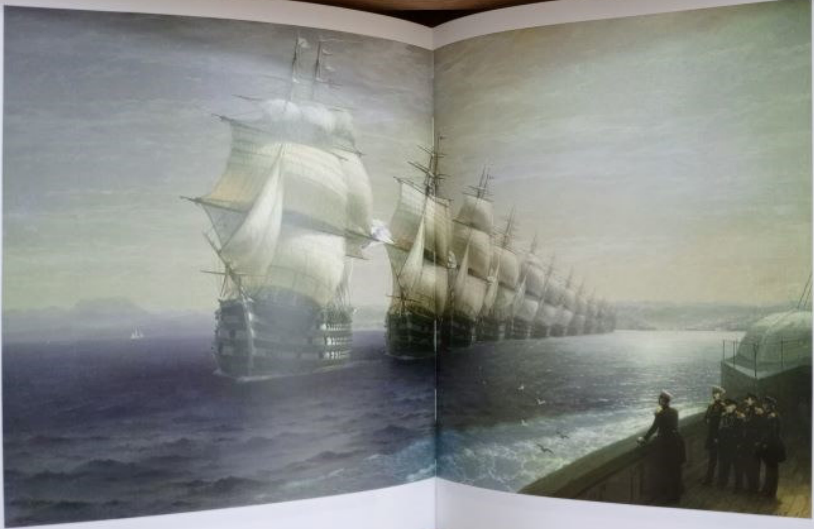
На протяжении многих веков основу парусного флота – паруса, корабельные снасти – составляло «пенечное» (пеньковое) волокно, получаемое из конопля.