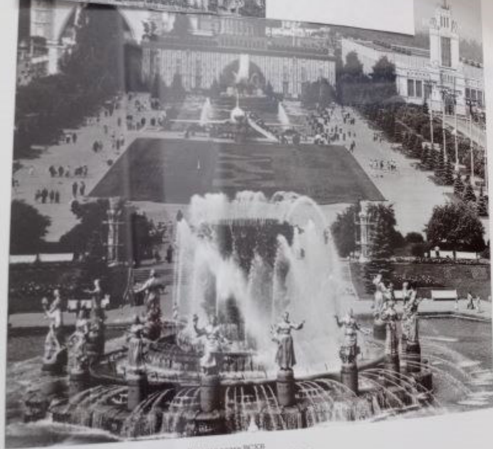
Главная ось ВДНХ The Central axis of the All-Union Agricultural Exhibition