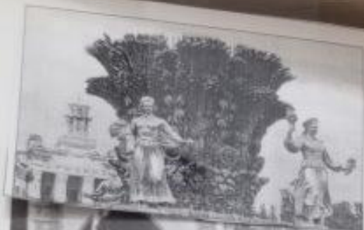
Москва. ВДНХ. В центре фонтан «Дружба народов» - гигантский символ из пшеницы, полсолнуков и хлопчаточесной конопли.