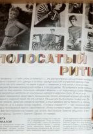
Ковалева, С. Полосатый ритм. - СПб.: АСТ, 2010. - С. 14-15.