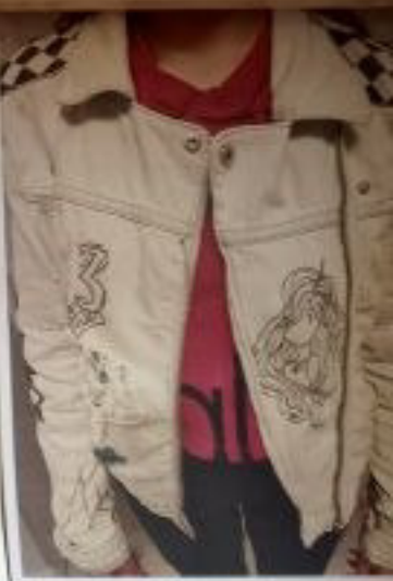
Клетчатые узоры в работе студента 3-го курса «Школа дизайна» и Графики (узоры, геометрия, ритмичность и перспектива) дизайнерских и клетчатых тканей.