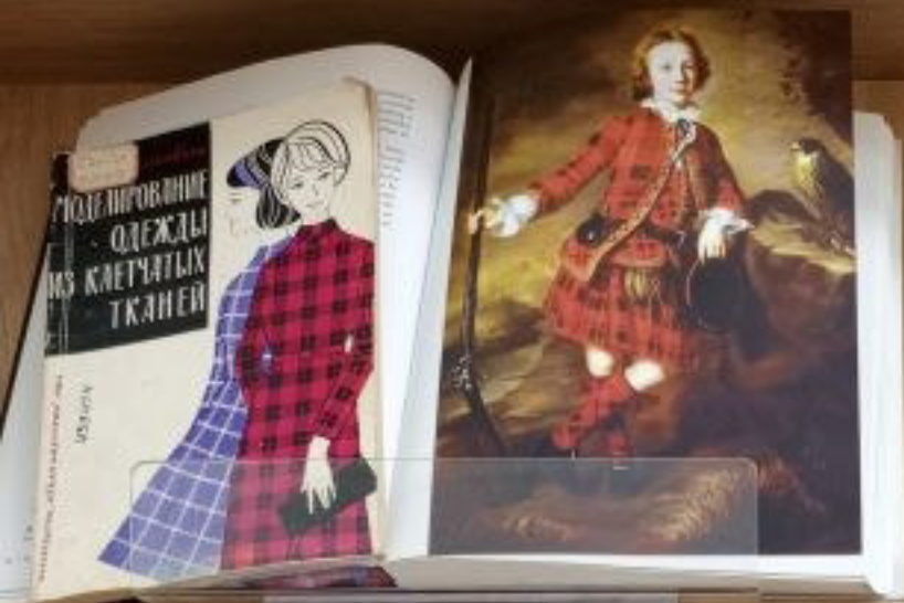
ИСТОРИЯ Моды, 1-й том. - Нью-Йорк: WILEY, 2006. - 324 с.