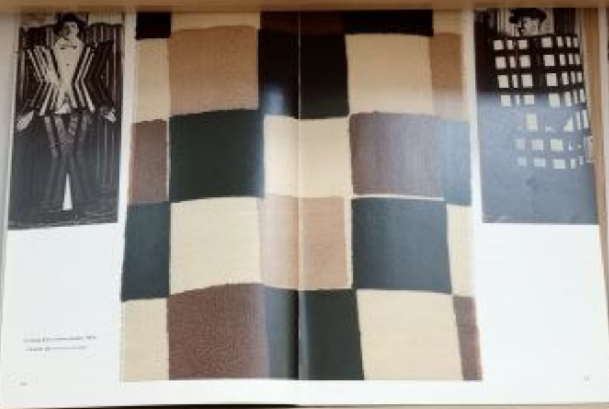
КНИЖКА КНИЖКИ, 1. Книга Текстиль / Fashion and Fabrics. - Лондон: Thomas & Hudson, 2001. - 128 с.

Какие бывают узоры клетчатых тканей? 1. Мелкая клетка 2. Полка 3. Большая клетка 4. Полоска-мелочь 5. Полоска-бандерка