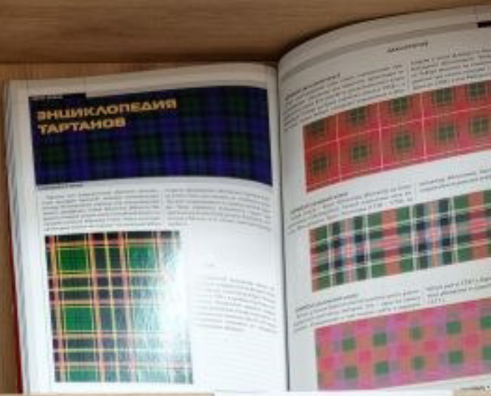
Текстиль: применение. - 1996. - 30 с.

Какие бывают узоры клетчатых тканей? 1. Мелкая клетка 2. Полка 3. Большая клетка 4. Полоска-мелочь 5. Полоска-бандерка