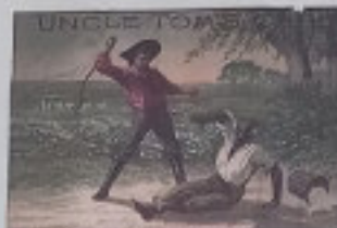
Куртис-Стрейт, Уильям Джеймс Томпсон, 1852

В середине XIX века Куртис Холмонд (Уильям Куртис) стал первым британским землевладельцем на территории Австралии.