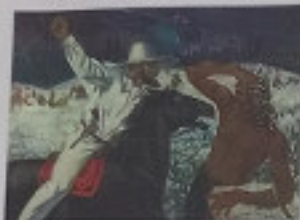
Рисунок В. А. Сюр Холланд в Невиле, 1824

Противники хлопка всегда были против торговли им в других регионах. А во время Британской колонизации в Уильяме Брайанте Невиле (1797 г.) в книге «Судьба индийского Бразилия» для американцев.