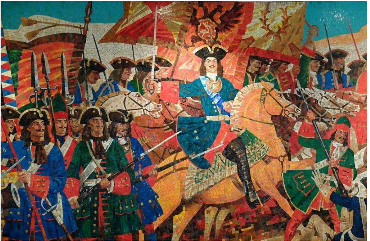
Быстров, А. К. Панорама Полтавской битвы, 2008: мозаика / станция метро «Звенигородская»

В Полтавской битве (27 июня 1709 г.) Карл XII потерпел сокрушительное поражение. Шведы потеряли не менее 6000 убитыми. Уцелевшие под Полтавой части сдались, и в плен попало ещё около 16 тыс. человек. Шведская сухопутная армия перестала существовать. Сам Петр был в гуще событий. Шведская пуля даже пробила царю шляпу, не ранив, однако, самодержца.