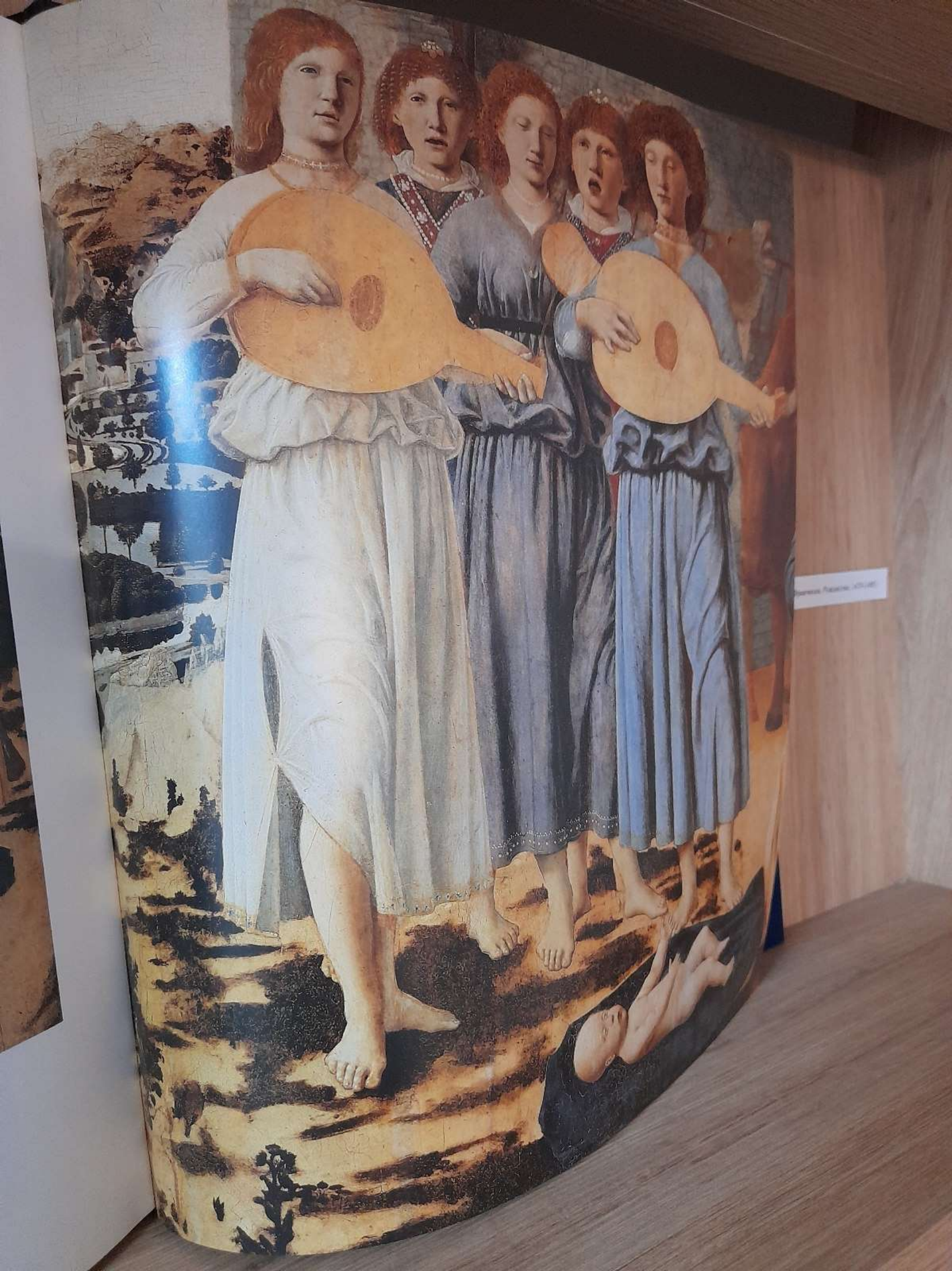
Primavera, Sandro Botticelli, 1477