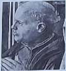
Филлиппо Липпи, ок. 1450

Филлиппо Липпи (ок. 1400 - ок. 1469) - итальянский живописец, скульптор, архитектор, поэт и драматург. Родился в Флоренции. В 1423 году переехал в Пизу, где работал в мастерской Джотто. В 1439 году переехал в Сиену, где работал в мастерской Верроккьо. В 1445 году переехал в Флоренцию, где работал в мастерской Мазаччо. В 1459 году переехал в Венецию, где работал в мастерской Тинтолетто. В 1469 году переехал в Венецию, где работал в мастерской Тинтолетто. В 1470 году переехал в Венецию, где работал в мастерской Тинтолетто.