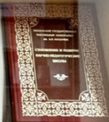
Таблетки обложки старинных газет о жизни ПТУ им. А. Н. Косыгина