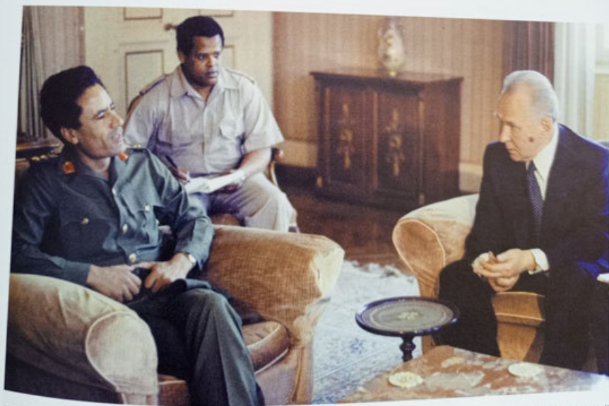
1975 г., май. Официальный визит А.Н.Косыгина в Ливию по приглашению руководства Социалистической Народной Ливийской Арабской Джамахирии. Знакомство с руководителем Ливийской революции, полковником Муамаром Каддафи.