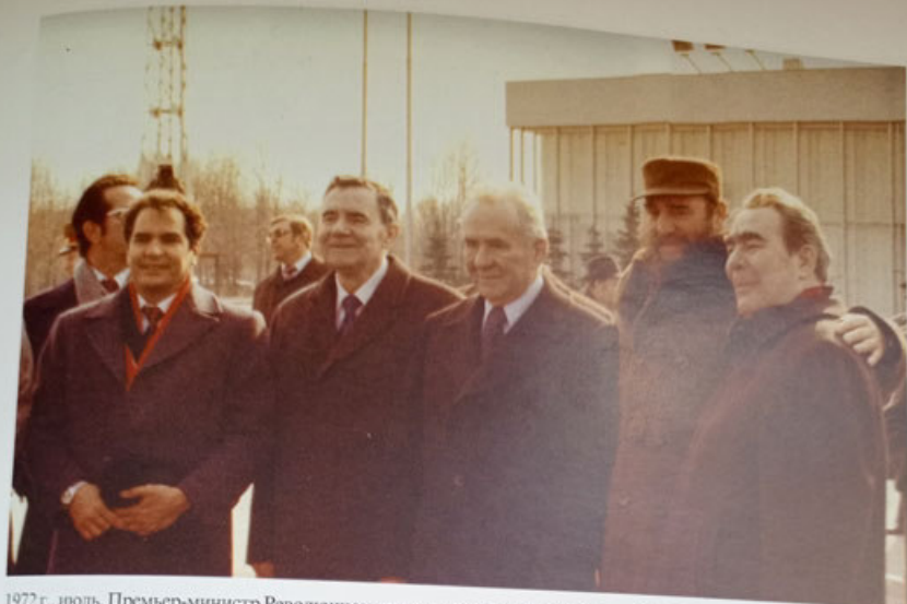
1972 г., июль. Премьер-министр Революционного правительства Республики Куба Фидель Кастро Рус в Москве.