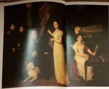
Василий Тропинин. Женщина в белом. 1865—1870 гг.