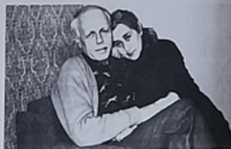
«Одно сердце на двоих»: Андрей Сахаров и Елена Боннёр

А 22 января по дороге на работу был задержан, а затем вместе с женой без суда сослан в Горький – город, в то время закрытый для иностранцев.