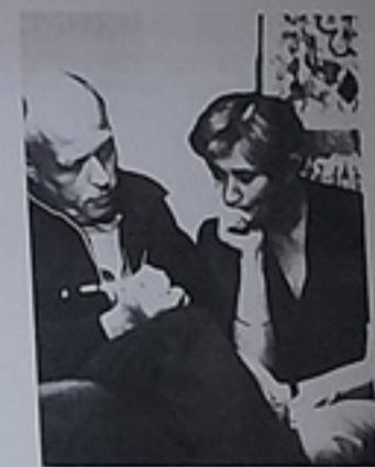
А. Д. Сахаров с женой Еленой Боннёр через барьер в камере при видеонаблюдении, 21 августа 1979 года

Сам Сахаров связывал ссылку со своими выступлениями против ввода советских войск в Афганистан. Ссылка продлилась 7 лет. В квартире Сахарова и его жены, известной правозащитницы Елены Боннёр (1923-2011), не было телефона. Круглосуточно велось видеонаблюдение.