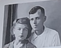
А. Д. Сахаров и Е. А. Боннёр, Ленинград, октябрь 1961.