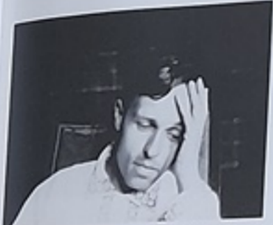
А. Д. Сахаров, Москва, 1961.