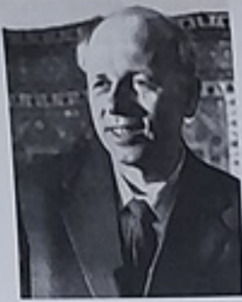
Андрей Сахаров, только что узнанный (1975 г.) о присуждении ему Нобелевской премии мира

«Если не я, то кто? ...»: к 100-летию со дня рождения Андрея Дмитриевича Сахарова (1921-1989)