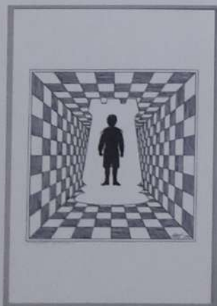
Василина-Прохорова, Е. Иллюстрация к роману "Защита Лужина", 1999: бумага, тушь, перо.

Набоков, В. Избранные произведения: [Защита Лужина (и др.)]. – М.: Советская Россия, 1989. – 400 с.