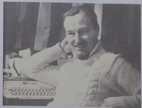
Джон Браннер (1934-1995)

Браннер, Д. Квадраты шахматного города: научно-фантастический роман. – М.: Мир, 1984. – 396 с.